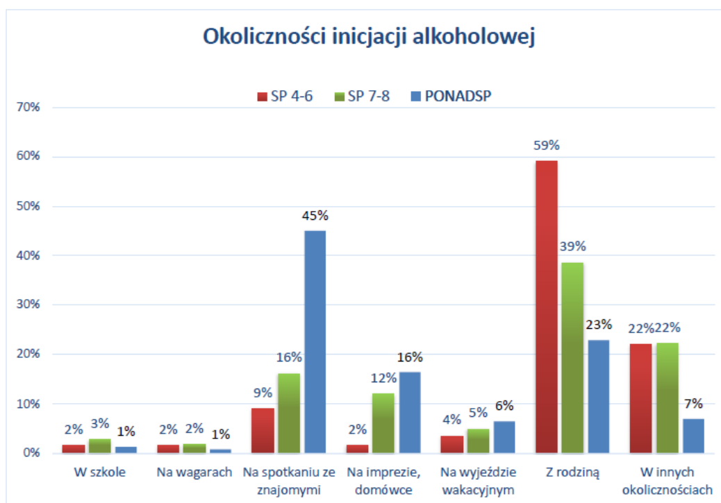
Wykres 1. Okoliczności inicjacji alkoholowej